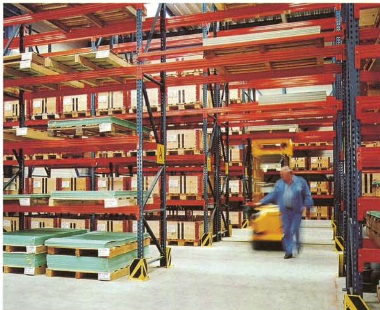
Abb. 2: Das vor zwei Jahren fertiggestellte Hochregallager ermöglicht grössere Lagerkapazitäten und eine schnelle Lieferfähigkeit.