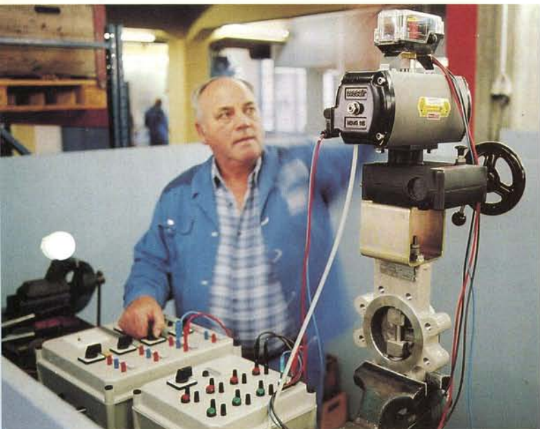
Abb. 1: Einregulierung und Prüfung einer Absperrklappe mit pneumatischem Drehantrieb.

Die grossen Vorteile und Stärken der Franz Gysi AG sind ihr breites Sortiment, die vielfältigen Beziehungen zu ihren Lieferanten und die umfassenden Dienstleistungen. Das Unternehmen ist so auch bei grossen Projekten in der Lage, wirtschaftliche Gesamtlösungen anzubieten. Dabei werden Qualität und Sicherheit der Produkte ins Zentrum der Abläufe gerückt. Gewährleistet wird dieser Anspruch nicht zuletzt durch ein intensives Qualitätsmanage-