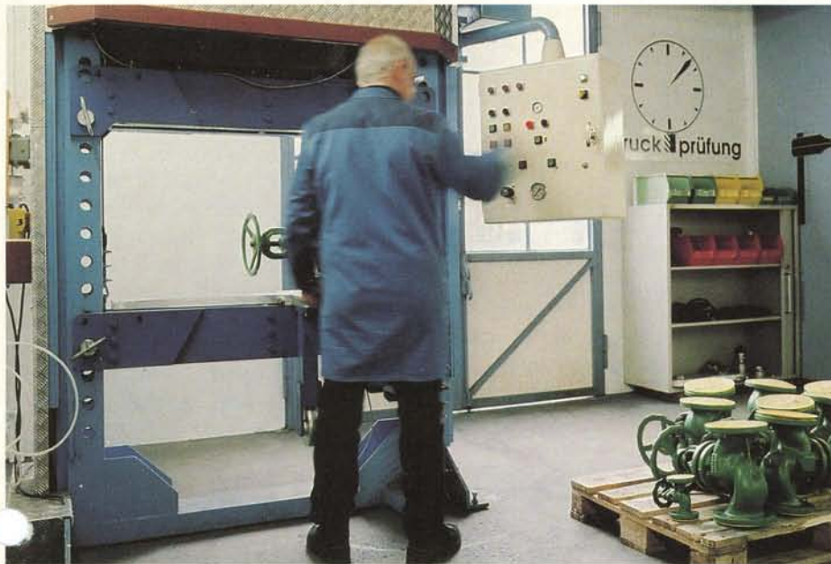
Abb. 3: Drucktest von Absperr-Armaturen bei der Wareneingangs-Kontrolle.