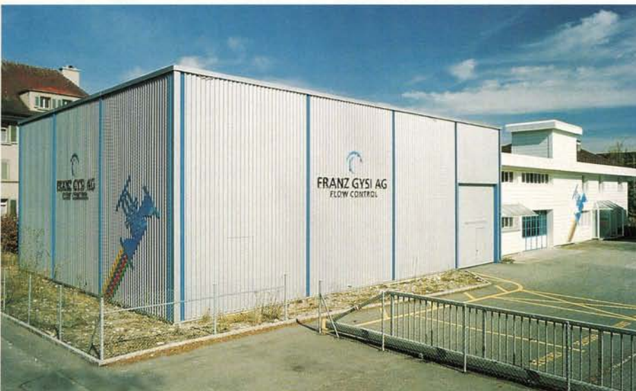
Abb. 7: Ansicht Firmensitz in Suhr.