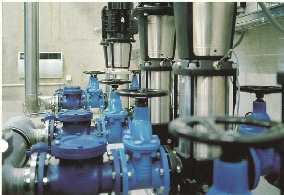
Abb. 4: Absperr-Schieber und Rückschlag-Klappen der Franz Gysi AG in einer Pumpstation. In dieser Anlage wird Enteiser-Abwasser gesammelt und rezykliert.

ment durch ISO 9002. Der hohe Prüfstandard wird unter anderem durch selbst entwickelte Maschinen und Geräte erreicht.